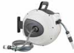
ENROLADOR AUTOMÁTICO MANGUEIRA 20M 1/2"