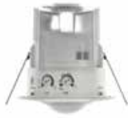
DETECTOR MOVIMENTOS LUXA 103-100 C DE BR