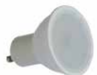
LÂMPADA LED GU10 9W 810Lm 3000K 100° 50x55mm 25 000h