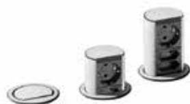
ELEVATOR 1x SCHUKO + 2x Euro + 2m CABO + FICHA