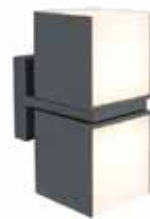
ARMADURA PAREDE CUBA LED 23W 3000K 2x500 Lm IP54