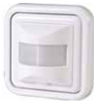
e2.3 DETECTOR MOVIMENTO 160° IP20 2/3 FIOS