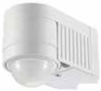
e18 DETECTOR MOVIMENTO 360° IP44