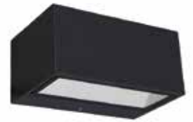
ARMADURA PAREDE GEMINI LED 9W 4000K IP54