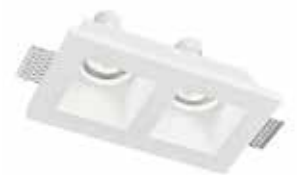
ESTRUTURA GESSO GHOST 2xGU10 - 21,4x11,8x5,5cms