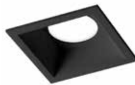
ESTRUTURA QUADRADA PRETA AYRIS 1xGU10 - 8.3x8.3x11.1cm