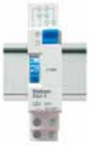
AUTOMÁTICO ESCADA ELPA 8 @