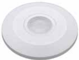
e15 DETECTOR MOVIMENTO 360° IP20 C/ MICRO