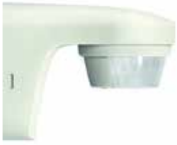
DETECTOR MOVIMENTOS theLUXA S180 E 10A IP55 BR