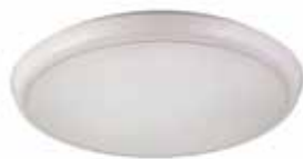
e39 PLAFOND LED 16W 4000K 180/360° SENSOR IP65 IK10