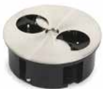
TWIST 2x SCHUKO + 2m CABO + FICHA