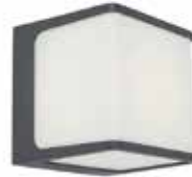
APLIQUE TELIN LED 15W 3000K 800Lm IP54